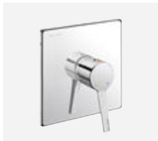
Brause-Einhebelmischer für Unterputzmontage Art. DELABIE: 2541 + 254BOX