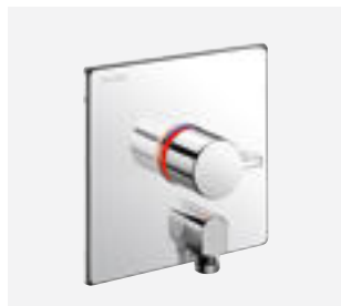
Brause-Thermostatarmatur für Unterputzmontage Art. DELABIE: H9633 + H96CBOX

Alle Abbildungen sind auf der Webseite delabie.de verfügbar, Rubrik „Presse“.