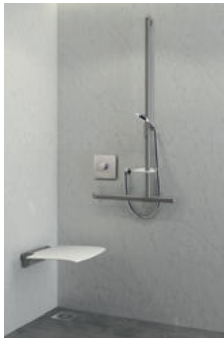
Montagebeispiel Dusche mit Brausearmatur H9631 Art. DELABIE: H9631