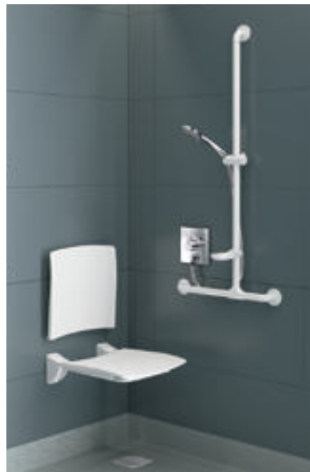
Montagebeispiel Dusche mit Brausearmatur H9633 Art. DELABIE: H9633