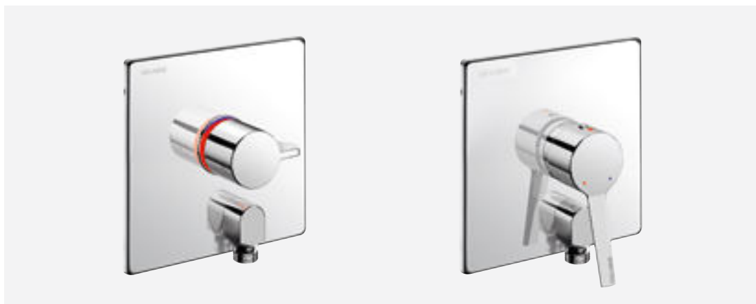
Art. DELABIE: H9633 und 2551 (EP)

DELABIE hat die Brausearmaturen für Unterputzmontage mit einem 100 % wasserdichten Unterputzkasten neu herausgebracht. Das innovative System lässt sich an zahlreiche Montagekonfigurationen anpassen. Aufgrund ihrer Bauweise trägt es zur Sicherheit der Patienten bei, aber auch zur Prävention von nosokomialen Infektionen und zum allgemeinen Komfort.